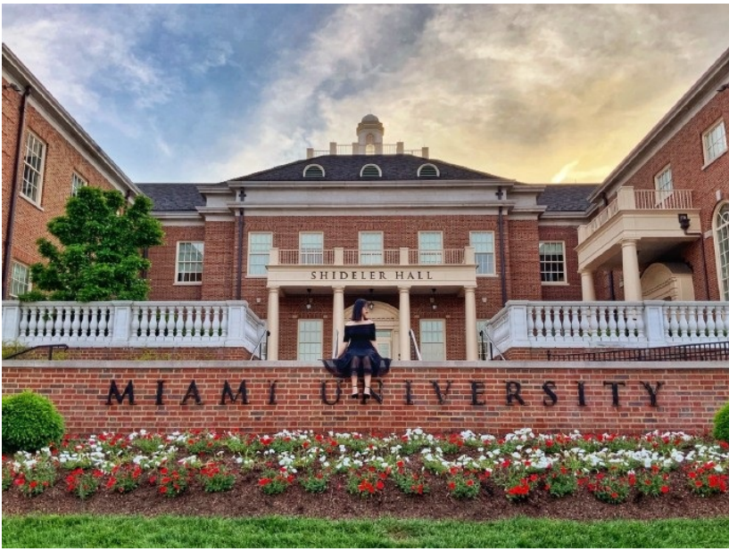
图10：校园网红牌匾（？）留念