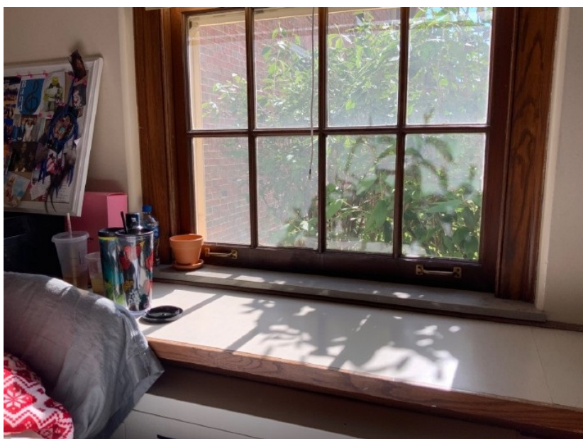
图2：洒满阳光的宿舍窗台 二、食堂 由于住在宿舍而被要求买meal plan，且住在宿舍每天自己做饭也并不现实，所以我学期中基本混迹在几个食堂中。爱吃西餐的同学（我）一开始会觉得还不错，匹萨意面汉堡薯条炸鸡色拉...由于都是buffet（刷一次卡随便取餐），随着时间的推移，吃多了就有一点想念家常菜的味道了，蔬菜基本是生的或者水煮，肉也或炸或煎...中国学生最青睐的是炒饭，但是吃一个学期基本也...（一言难尽）三、人数配比 听说这是一所白校，所以基本以白人学生为主，亚洲国际生第二。亚洲国际生以中国人为主，越南人第二（这里的越南学生大多都很优秀），所以随处可见的中国人会让你以为自己只是在在中国的全英语授课的国际学校就读...（尤其是CS专业的朋友们）