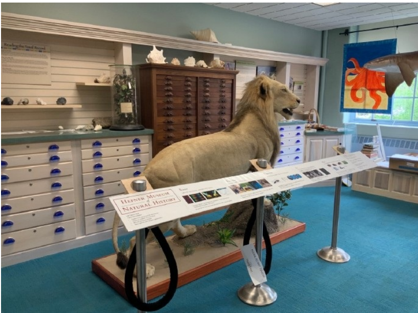
图5：生物学院里的标本（感觉像走进了自然博物馆） 五、村里和村外的周边及食物 整个牛津村都是以MU及其在校生为主的，