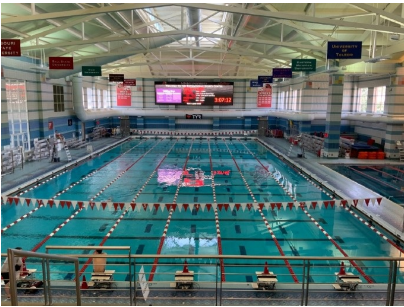
图3：健身房里的游泳池（边上还有温泉） 四、交通 住在宿舍的感想就是上课还比较方便吧，我住在学校的东南角，离常去上课的东北角商学院步行15分钟，离计算机学院步行12分钟，在学校内部仅靠步行还比较便捷。在牛津小镇（我们简称牛村）里有多条公交线路，刷学生id就可以免费乘坐，最远可到Walmart，在另一个大型超市Kroger，小中国超市（牛村超市），麦当劳和附近off Campus住宿小区往返学校非常方便。但是村外只能靠朋友开车带出去了，虽然出去了也没什么好玩的...（原谅我一个学期也没出过几次村...）