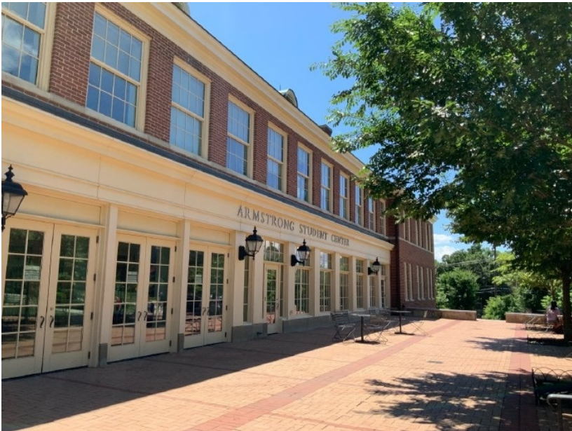
图4：学生中心（很多学生自习&就餐的好去处）