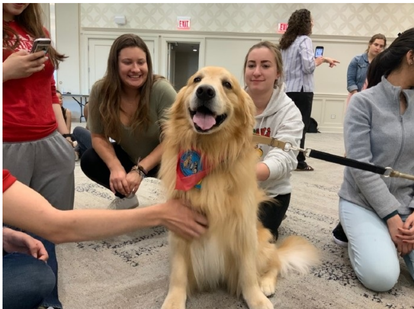
图8：期末季非常解压的dog therapy 活动方面，这里有中国学生组织和各种社团、兄弟会姐妹会等等（由于想好好学习所以没有加入固定组织），也不得不提到和我们有最大关联的ISSS组织——相当于学校的外事处。里面的老师也都非常nice，从在复旦申请项目的时候开始交流一直到入学后组织的各种orientation迎新活动。交换生们被邀请参加了一个个文化类的晚宴，比如Chinese culture 分享、Where do you from（如何定义你从哪里来，地理上和个人认知上的归属感）等等，也经常有面向全体留学生的正式宴会（需要穿casual business 较为随意的职业装），介绍餐桌礼仪及相关的文化差异等。不得不提到ISSS举办的一次召集国际生前往当地小学讲故事的一次活动，我和另两位亚洲同学报名参加了此次活动。我们向美国小学生们介绍了自己在小学时候喜欢的一些故事（动画、书籍），也和他们交流了中国（和韩国）小朋友的生活琐事和升学压力。这次活动不仅让我们参观了真实的美国小学，也让我了解到美国小学生的课余生活（一般是参与体育活动）。

见过另一节专业课老师在教室里四处奔波、甚至跪着回答同学们project上的问题，但最后挂了那个旷了n节课迟交了n次作业的女生。