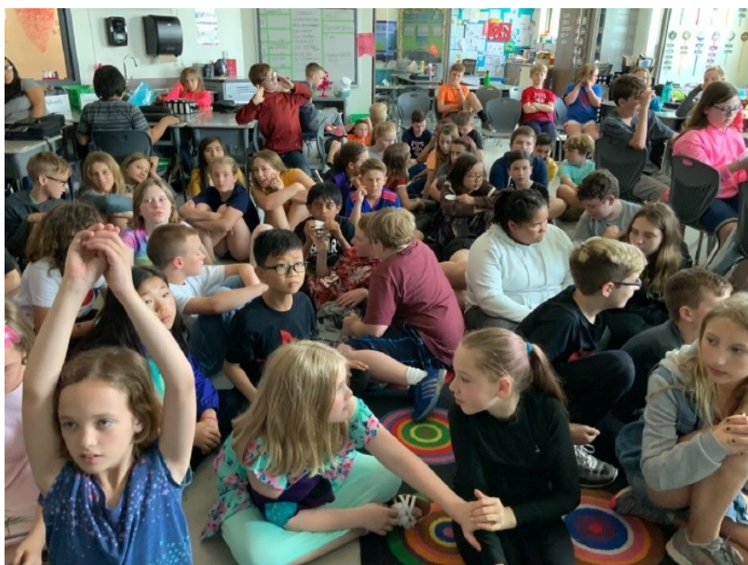
图9：第一次参观美国小学&调皮的小学生们 在参加了一系列这样的活动以后，我对于国家、世界和自我的关系又有了进一步的认识。我仅仅是我，可以来自上海，也可以来自Oxford，归属感是自己定义的，或者说自己从社交圈、稳定学习或工作等去寻找归属感，也可以从一个人对自己归属感的定义中看出他的国际视野以及对diversity的包容性。七、总结 总而言之，如我在交换前读到唯一的一篇学长学姐分享一样，这是一个可以摒除一切杂念安心学习的地方（因为实在没有太多好玩的），合理利用学校的食堂和健身房还可以减肥，可以和教授多交谈也可以找到许多朋友（至于是老美还是中国人纯属看个人选择），看似学习紧张但一定会有回报，也可以让科研小白打开科研世界的大门！最重要的，校园真的是很漂亮呀！

图8：期末季非常解压的dog therapy 活动方面，这里有中国学生组织和各种社团、兄弟会姐妹会等等（由于想好好学习所以没有加入固定组织），也不得不提到和我们有最大关联的ISSS组织——相当于学校的外事处。里面的老师也都非常nice，从在复旦申请项目的时候开始交流一直到入学后组织的各种orientation迎新活动。交换生们被邀请参加了一个个文化类的晚宴，比如Chinese culture 分享、Where do you from（如何定义你从哪里来，地理上和个人认知上的归属感）等等，也经常有面向全体留学生的正式宴会（需要穿casual business 较为随意的职业装），介绍餐桌礼仪及相关的文化差异等。不得不提到ISSS举办的一次召集国际生前往当地小学讲故事的一次活动，我和另两位亚洲同学报名参加了此次活动。我们向美国小学生们介绍了自己在小学时候喜欢的一些故事（动画、书籍），也和他们交流了中国（和韩国）小朋友的生活琐事和升学压力。这次活动不仅让我们参观了真实的美国小学，也让我了解到美国小学生的课余生活（一般是参与体育活动）。